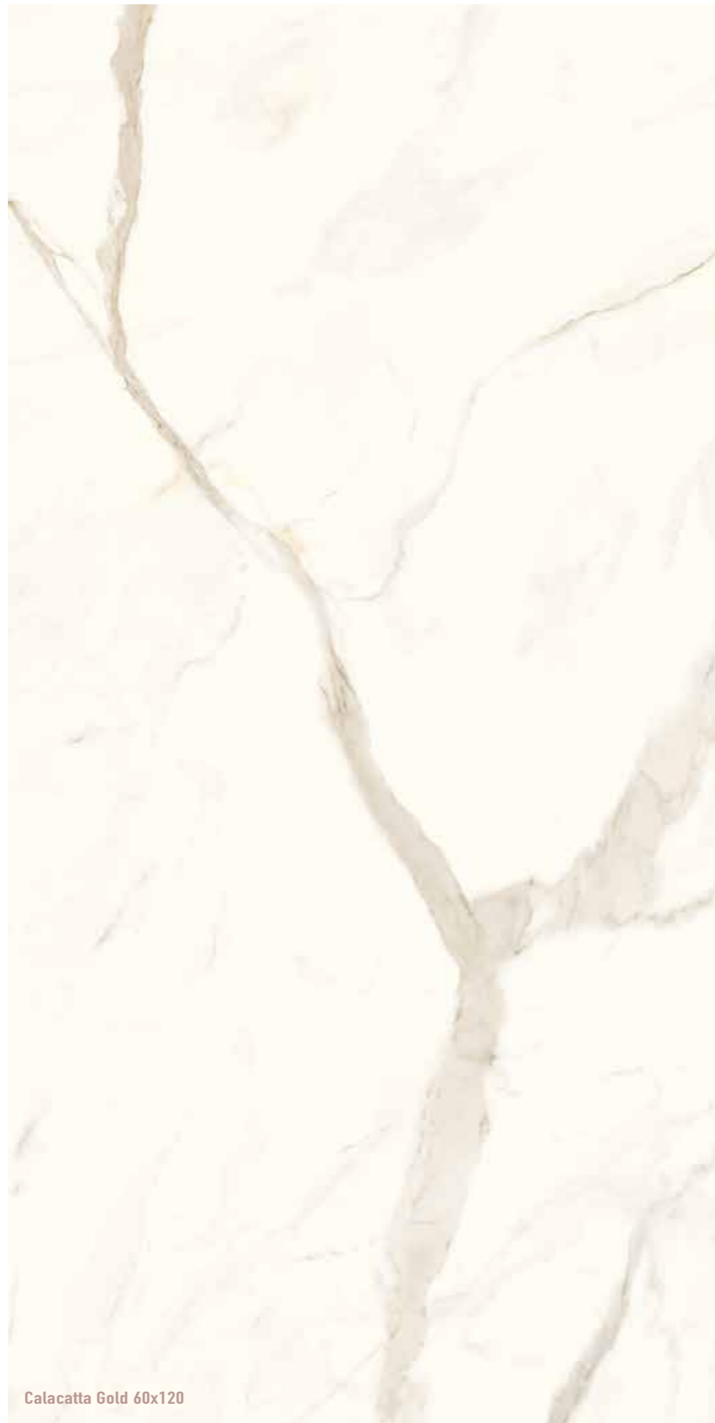
Calacatta Gold 60x120